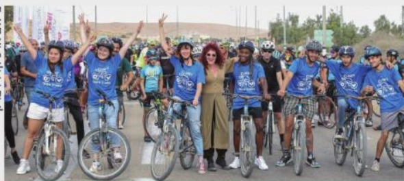
משתתפים במסע קודם של "בשביל השנטי". המצב השנה לא מאפשר רכיבה בעוטף

«העלאת המודעות למצבם של בני הנוער בסיכון במלחמה»